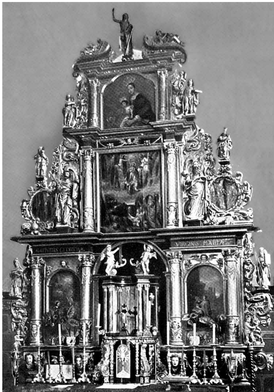
Barokowy ołtarz kościoła w Pierzchałach sprzed 1945 r. według A. Ulbrich, w: Geschichte der Bildhauerkunst in Ostpreussen, Königsberg 1926–1929 , tabl. 15.