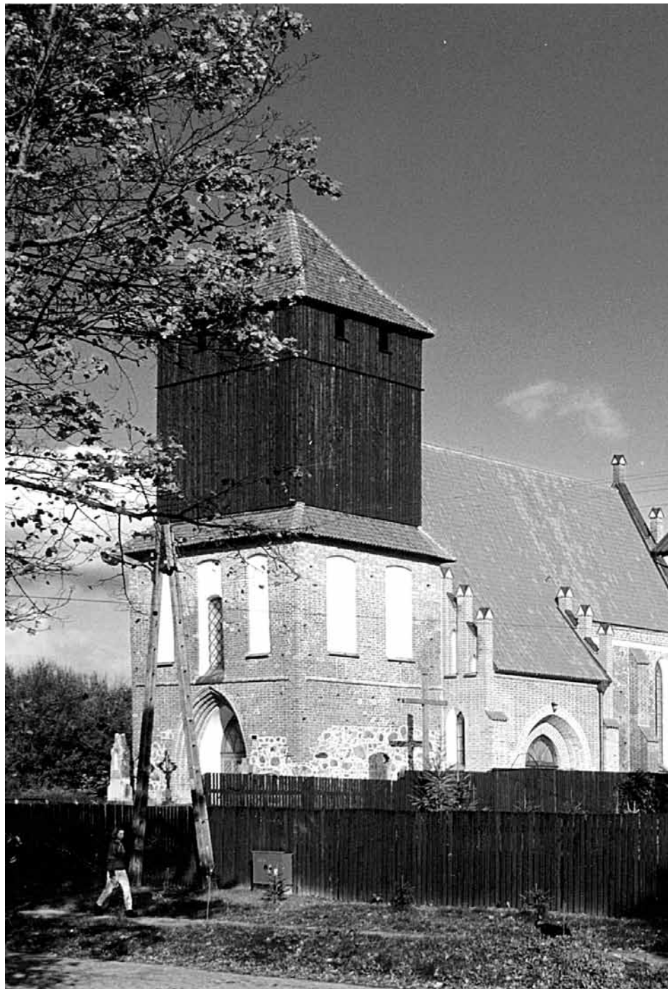
Odbudowany kościół w Pierzchałach