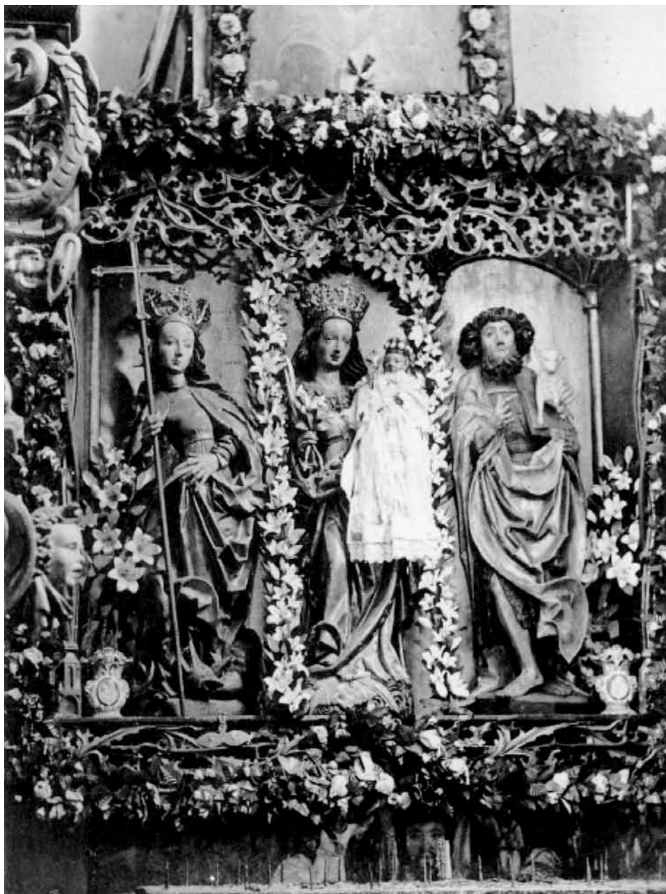
Środkowa część ołtarza gotyckiego w kościele w Pierzchałach sprzed 1945 r., w: A. Boetticher, Die Bau- und Kunstdenkmäler in Ermland, Königsberg 1894, tabl. XI.