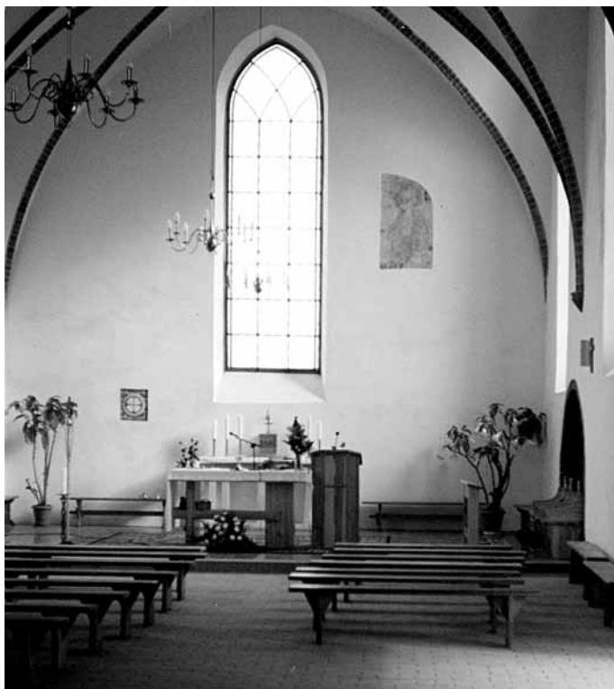
Prezbiterium odbudowanego kościoła w Pierzchałach

w górnej z drewna, z dachem pokrytym ceglana dachówką. W tym układzie architektonicznym odbudowano kościół obecnie.