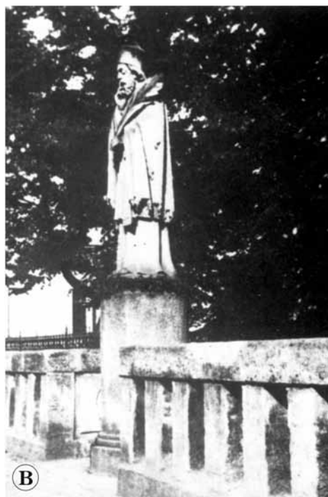
Statua św. Jana Nepomucena na olsztyńskim moście na Łynie. A — po odsłonięciu w 1869 r.; B — po przestawieniu na obrzeże mostu w 1909 r.; C — po restytucji i odsłonięciu 25. lipca 1996 r.